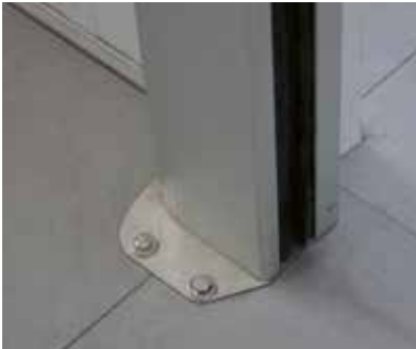
Detalle de fijación al suelo